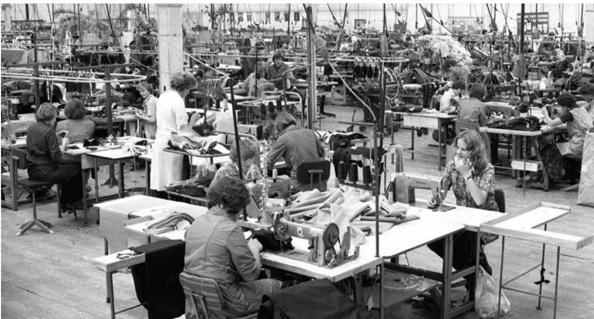
Zakłady Przemysłu Odzieżowego „Cora”, Garwolin. W latach 70. „Cora” była jedną z wiodących firm na polskim rynku odzieżowym, miała kilka oddziałów, m.in. w Garwolinie. Ubrania eksportowano do krajów Europy Wschodniej, Zachodniej, a nawet do USA.

II wojna światowa dramatycznie pokazała przewagę krajów przemysłowych nad rolniczymi, przewagę silnika spalinowego nad koniem. Po wojnie rozwój przemysłu stał się nie tylko potrzebą rozwoju cywilizacyjnego kraju, lecz także koniecznym warunkiem zbudowania nowoczesnej techniki wojskowej. Zwłaszcza że sytuacja międzynarodowa wskazywała na możliwy konflikt zbrojny. Podstawowym celem gospodarki Polski Ludowej było więc uprzemysłowienie realizowane za wszelką cenę. Dzisiaj często krytykuje się wybór takiej polityki przemysłowej, nastawionej na „wielkie budowy socjalizmu”, wymagającej dużego wysiłku ze strony społeczeństwa. Ale w ówczesnych realiach gospodarczych i politycznych kraju nie było alternatywy dla takiej polityki gospodarczej. Dopiero znacznie później pojawiały się możliwości pewnego wyboru, z których korzystano w różny sposób. Aby to zrozumieć, dobrze jest przypomnieć okres transformacji gospodarczej z 1989 roku, zwanej często szokiem Balcerowicza. Niezależnie od tego, co teraz opowiadają różni eksperci, w ówczesnej sytuacji kraju innej drogi też nie było. Czym innym natomiast był czas funkcjonowania tej polityki gospodarczej, bo jej zmiana mogła nastąpić dużo wcześniej. I wiele środowisk politycznych mogło to zrobić.