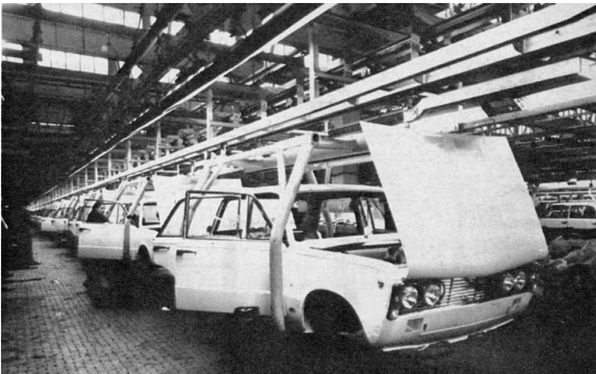
Produkowane w FSO na włoskiej licencji fiaty 125p obok maluchów królowały na polskich drogach.

Według spisu z 1931 roku 60% zawodowo czynnej ludności pracowało w rolnictwie, tylko 19,4% w przemyśle, 6,1% w handlu i 3,6% w komunikacji. Inwestycje przemysłowe zaczęły się dopiero pod koniec lat 30. i nie zdążyły przynieść oczekiwanych efektów. Nowe zakłady rozpoczynały produkcję tuż przed wojną, potem częściowo produkowały w czasie okupacji niemieckiej. Ich szybki rozwój nastąpił dopiero po 1945 roku. Wyobrażenie o poziomie rozwoju przemysłu w II RP pokazują dane o wielkościach produkcji ważnych wyrobów dla wybranych państw europejskich. Wskaźniki zostały obliczone na podstawie danych z rocznika statystycznego z 1938 roku i dotyczą roku 1936 [4] (patrz tabela s. 12).