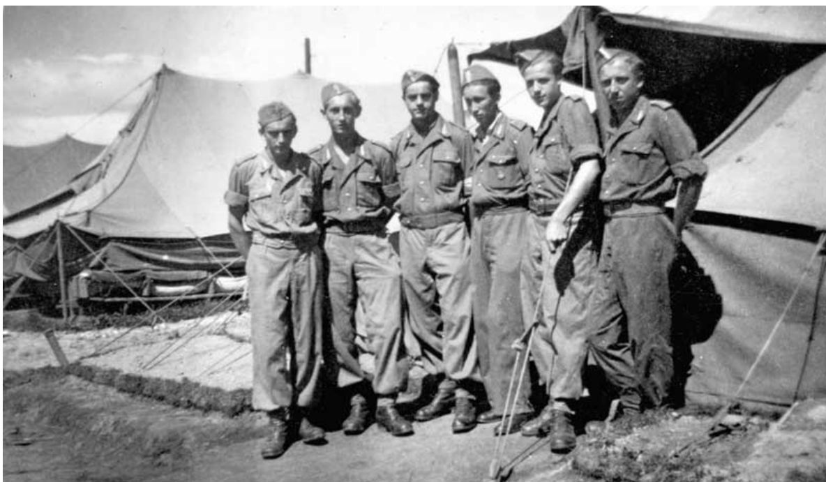
Ochotnicy Służby Polsce przy budowie Nowej Huty.

Polityka przemysłowa PRL znajdowała źródło w dwóch czynnikach: nowej ideologii i zastanym położeniu gospodarki polskiej. Ideologią była przeniesiona ze Związku Radzieckiego koncepcja budowy przemysłu, przede wszystkim ciężkiego, opartego na węglu, stali i cemencie, bo to on stanowił podstawę do budowy innych przemysłów, zwłaszcza zbrojeniowego. Druga przesłanka wynikała z zacofania gospodarczego Polski, biednego kraju rolniczego, który dodatkowo został zniszczony działaniami wojennymi. Dlatego budowanie przemysłu było obiektywną koniecznością dla rozwoju kraju i doganiania wymogów nowoczesnej cywilizacji. Proces uprzemysłowienia okazał się bardzo złożony, poświęcono mu wiele książek, wcześniej oceniających go pozytywnie, a teraz propagandowo negatywnie.